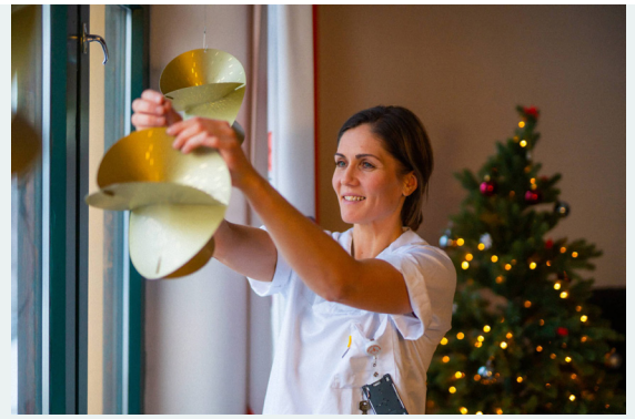
Bilde: Gi håp til jul

I julen henges det opp tusenvis av stjerner på norske sykehus og sykehjem, gitt av folk fra hele landet. Med hver stjerne gir vi glede og håp til de som er syke, de som besøker dem og de som jobber der. Aksjonen har bidratt med over 275 millioner kroner til kreftforskning og Kreftforeningens arbeid for kreftrammede. https://kreftforeningen.no/juleaksjonen/